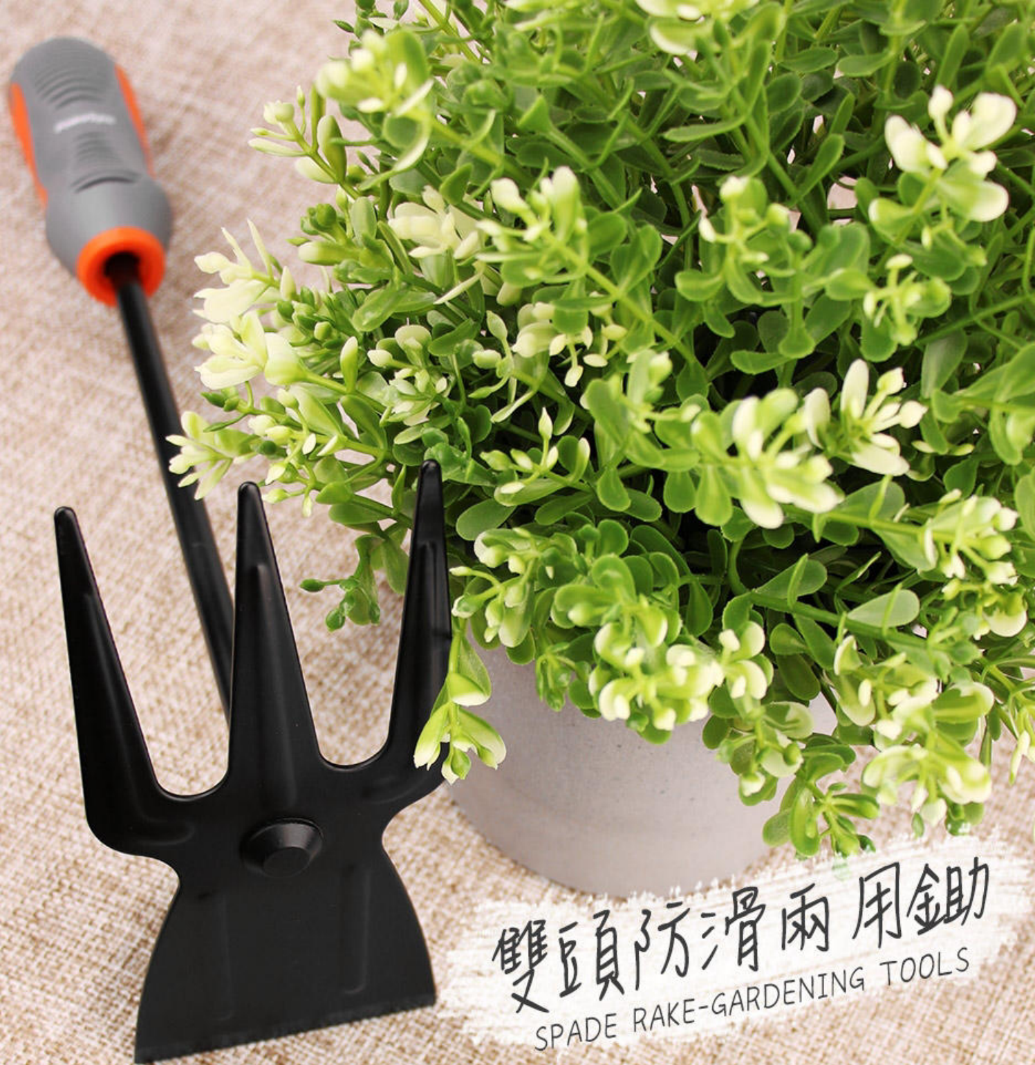
雙頭防滑兩用鋤 SPADE RAKE-GARDENING TOOLS